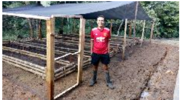
Construcción de huerta orgánica