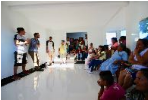
Explicación del proyecto a la comunidad.