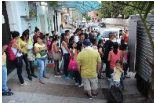
Entrega de remesas a familias