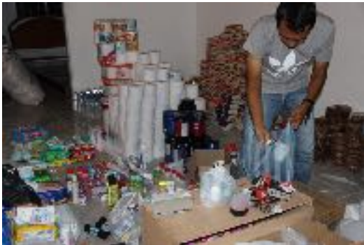
Preparación de remesas

FUNDEVACO entregó artículos de primera necesidad de manera quincenal a 75 familias víctimas de la avalancha desde el momento de su constitución.